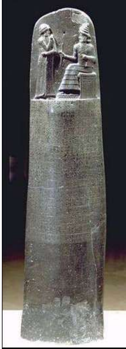
Codice di Hammurabi – 1700 a.C.